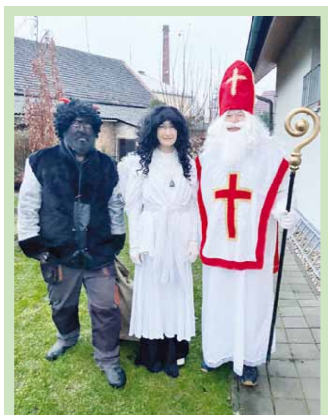
Břehy navštívil Mikuláš s andělem a čertem