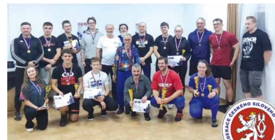
Účastníci soutěže Silák Břehů 2025

Závodní sezonu uzavřel v sobotu 6. 12. desátý ročník tradiční soutěže Silák Břehů. Letošního ročníku se zúčastnilo