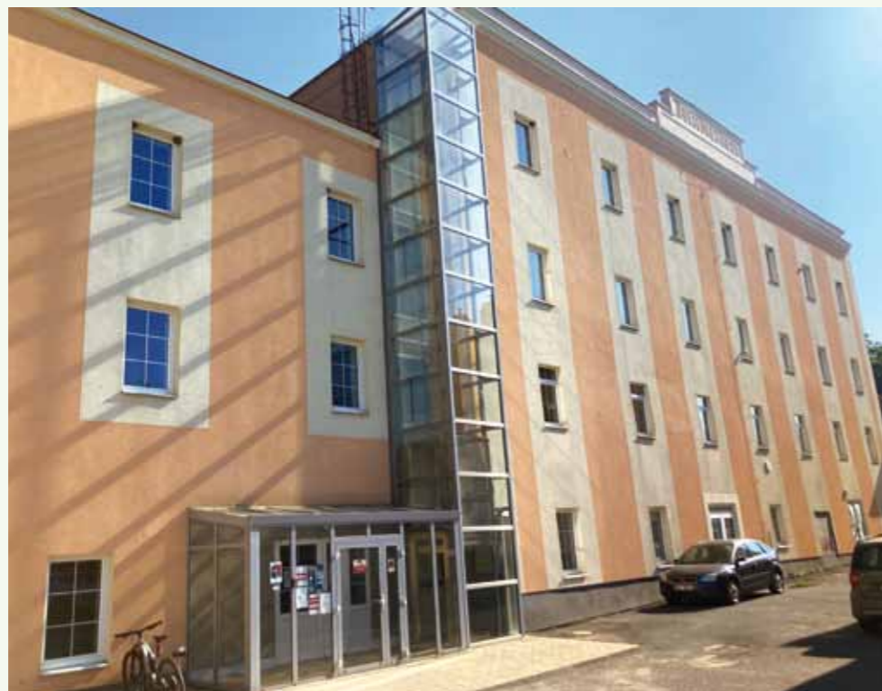
Multifunkční objekt mlýna

Já nejprve poreferuji o tom, co projednávalo obecní zastupitelstvo. Na 21. zasedání jsme v prvním bodě projednali možnosti využití č.p. 53 (bývalá Cikánka). Záměr zřízení dětské skupiny se vzhledem k výrazným změnám v plánované dotaci a nedostatku času stal nereálným, ale nový záměr je mnohem zajímavější. Díky zájmu dvou lékařů (zubaře a praktické lékařky) jsme se vydali cestou přebudování č.p. 53 na zdravotnické zařízení s ordinacemi těchto lékařů. Již máme ověřeno, že Pardubický kraj odbor zdravotnictví s tímto záměrem souhlasí a také pojišťovny s lékaři v našem regionu mají zájem uzavřít smlouvy. Nyní nám architekt připravuje studii a následně začne celý proces nejen získání stavebního povolení a přestavby, ale i změny využití budovy, zřízení ordinací atd. Budeme se snažit, aby bylo vše hotovo ve druhé polovině roku 2026. Dále jsme schválili vybudování vrtu na užitkovou vodu v MŠ, který bude realizován v létě. Ve mlýně ve 2. NP a 3. NP bylo pořízeno vytápění invertorovou klimatizací, které sníží náklady a zvýší komfort dětí ze školy i sportovců, kteří tam chodí cvičit. Projednány byly pokračující opravy v č.p. 11 –