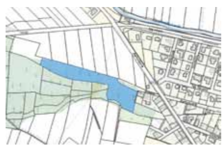
Parcela č. 392/1 - pozemek s funkcí lesa