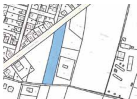
Parcela č. 155 (vedle TS)

A nezapomínejme, že pro volné pobíhání psů je vyhláškou OVZ č. 2/2022 přesně stanovený prostor v katastru obce (pod dozorem venčící osoby!).