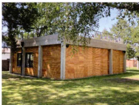
Venkovní učebna u ZŠ

Komisi se učebna se zelenou střechou a moderním vybavení opravdu moc líbila a věřím, že se v ní bude líbit od letošního září i dětem a pedagogickému sboru.