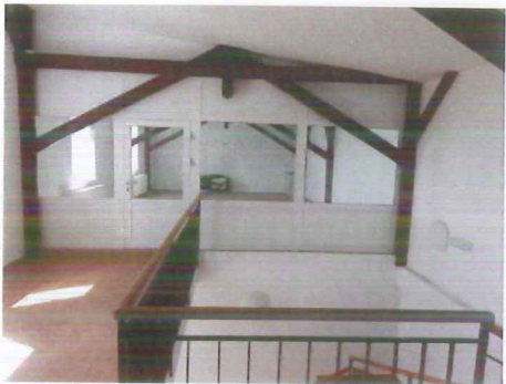
Zasedací sál ve 3. NP