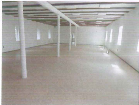
Výstavní sál ve 3. NP

(stavební objekt) SO-01 víceúčelová hala nebyla realizována (tehdy asi před deseti lety nám nebyla poskytnuta žádaná dotace). Proto existuje určitý deficit počtu záchodů mužů a žen v rámci areálu, které měly být u plánované haly.