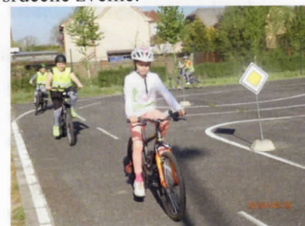
Na dopravním hřišti

Na jaře jsme navštívili dopravní hřiště v Přelouči a nyní se pečlivě připravujeme na akci ke 175. výročí naší školy, na kterou vás srdečně zveme.