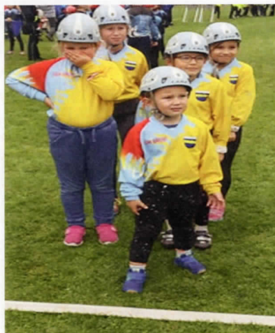
Naši nejmladší hasiči

V neděli 28.4. jsme pořádali Břežský pohár, který je zařazen do Ligy mladých hasičů okresu Pardubice a naši mladší obsadili 5 místo a starší 6. místo.