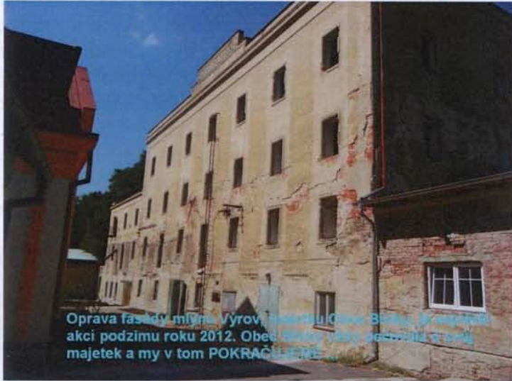
Oprava fasády mlýna Výrov. Investice Obec Břežany. Místní akční podzim roku 2012. Obec Břežany má v současnosti v majetku a my v tom POKRAČUJEME

Ostatní bude věcí dalšího rozvoje využití této velké budovy, která je pro obec velkou výzvou co do jejího využití.