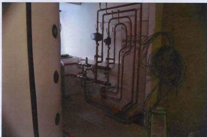
Elektrokotelna ve strojovně s ohřevem vody elektrinou vyrobenou v malé vodní elektrárně Výrov. Dvě akumulční nádrže po 1,5 m 3 poskytnou dostatečnou kapacitu teplé vody pro přízemí mlýnu