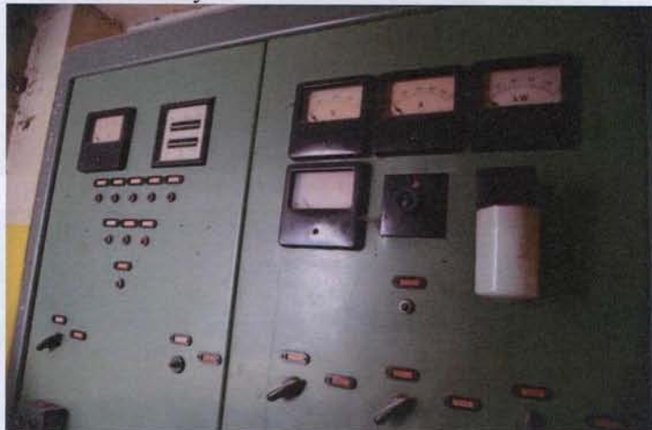
Starý rozvaděč elektrárny poslouží jako dekorativní příčka

Zastupitelstvem bylo odsouhlaseno další pokračování oprav v přízemí mlýnu. Bylo schváleno pokračování prací na rozvodech ústředního vytápění včetně podlahového v malém sále a koncepčního a dispozičního uspořádání pro budoucí osazení tepelného čerpadla. Do té doby však byla zastupitelstvem upřednostněna rozvázná strategie nejprve dokončení rozdělaných prací a zprovoznění topení toliko využívající energii malé vodní elektrárny, kdy pomocí akumulace ohřáté vody a jejího použití v pozdějším čase lze zajistit dostatečný energetický potenciál pro vytápění prostor v přízemí s výhledem na patra ve snížené části mlýnu.