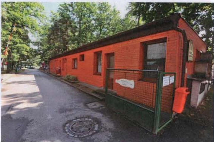
Zateplená restaurace v kempu