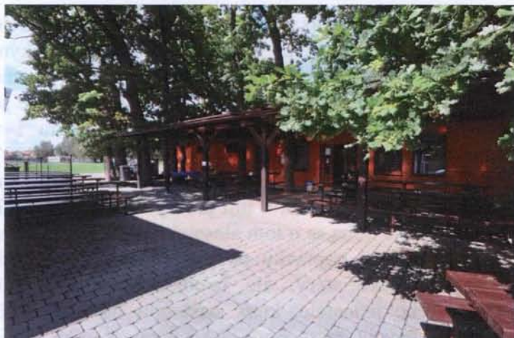
Se zahradním posezením

Kompletně jsme zateplili budovu Základní školy Břehy a tvoří tak, díky pedagogickému sboru, důstojný stánek pro vzdělání našich dětí