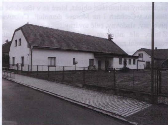
Mateřská škola před přístavbou

Obec má fungující mateřskou školku, která pojme namísto 25 dětí před přístavbou,