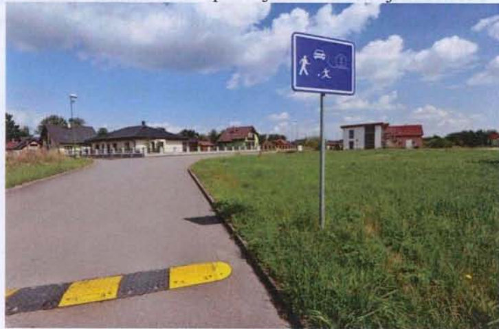
Nová obytná zástavba Na Novině

v budoucnu. Poděkování patří navíc těm, kteří si v nové zástavbě sami upravují okolí. Děkujeme Vám.