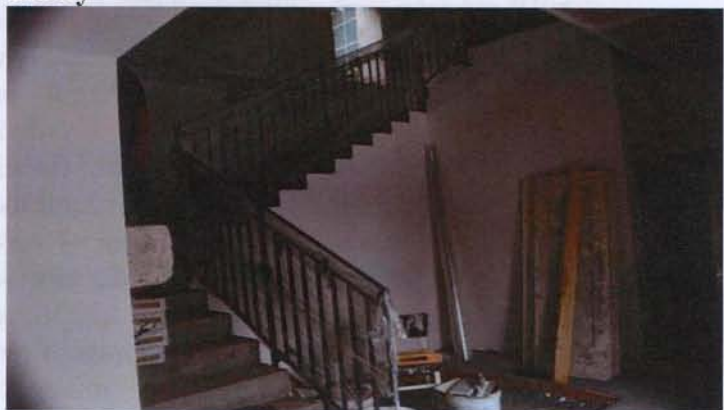
Nové železobetonové schodiště se zábradlím

Postupnou opravou interiéru mlýnu Výrov Obec Břehy získává v přízemí kulturní a volnočasové prostory. Výhledově se objekt mlýnu nabízí jako nízkoenergetický kulturní a společenský dům Obce Břehy