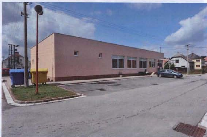
Prodejna potravin v novém kabátu