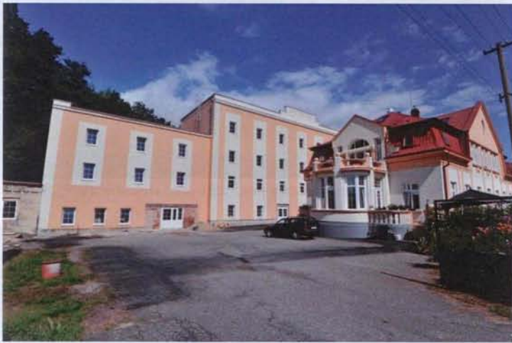
Budova mlýna po částečné opravě

Postupem času se však jistě najde řada vhodných aplikací pro volnočasové aktivity mládeže, kulturně společenské akce atd.