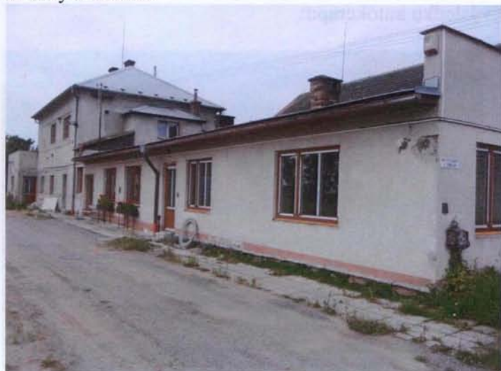
Bytový dům čp. 97 po výměně oken a dveří

Pokračují přípravné práce pro stavební dokončení. Pro zhotovení elektroinstalace bude vybrána firma z podaných 3 nabídek. Obdobně na vnitřní a vnější omítky a fasádu.