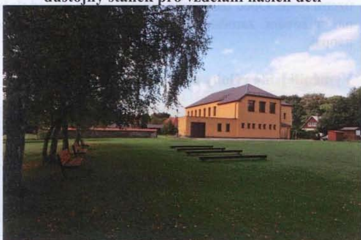
Základní škola Břehy

Kompletně jsme zateplili budovu Základní školy Břehy a tvoří tak, díky pedagogickému sboru, důstojný stánek pro vzdělání našich dětí