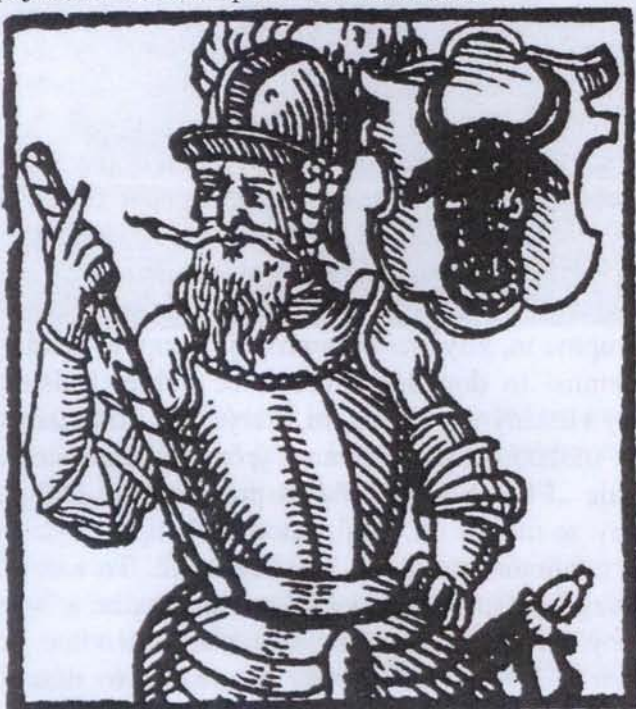
Vilém z Pernštejna založil mlýn Výrov (1514)

Zamykání vodárny proběhne asi 25.10.2014 a další větší akcí bude Den Opatovického kanálu v areálu sádek Rybníčního hospodářství v Lázních Bohdaneč. Související akcí bude jeden z výlovů rybníku napájeného vodou Opatovického kanálu.