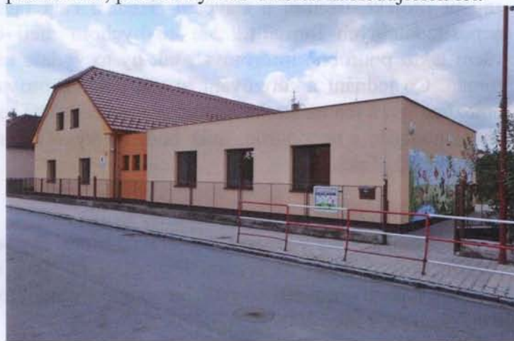
Mateřská škola po přístavbě

po přístavbě 43 dětí. To postačuje, a ještě řadu let bude postačovat, pro Břehy i do dalších následujících let.