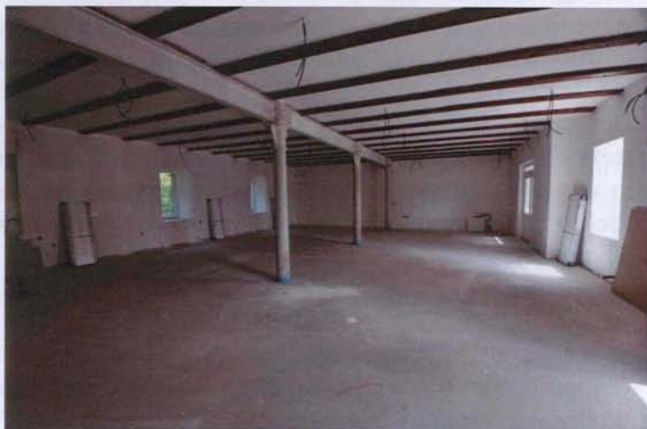
Malý sál v přízemí mlýnu ve fázi dokončovacích prací