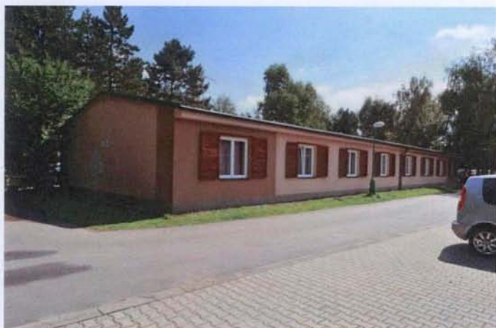
Zprovozněním nové ubytovny stouply tržby Autokempu Buňkov s.r.o. o více než 0,5 mil. Kč ročně

Několik poznámek pro posouzení hospodářského výsledku autokempu: