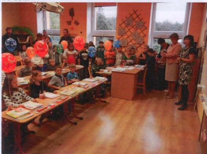
Ilustrační foto – zahájení školního roku 2013-2014

V novém školním roce 2014-2015 bude poprvé po mnoha letech otevřena opět samostatná první třída pro 18 dětí.