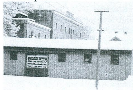
Mlýn v lednu 2010

Jedná se o záměr obce, jak nevyužitou část areálu mlýna, který jsme již v roce 2008 přihlásili do národního soupisu brownfields, přestavět na kulturní, sportovní a multifunkční objekt sloužící obci. Na akci již máme pravomocné stavební povolení.