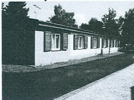
Ubytovna v kempu

pracovní místa“ ... a tento úkol jsme splnili. Úplná návratnost vložených investic je u takových staveb vždy v řádu desetiletí.