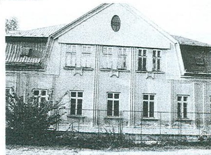
Bytový dům na Výrově – majetek obce

v areálu původního mlýnu, zase tak špatná není. Je to blízko do lesa, do školy. Jsem rád, že se snad podaří zase zvýšit počet bytů v obci a děkuji i zastupitelstvu. Snad se nám podaří dokončení a okna se rozzáří světly nových bydlících. Ta světla mám z doby minulé ještě v živé paměti.