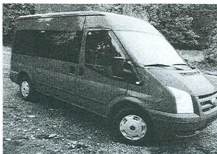
FORD TRANSIT obce Břehy

Proto hned v pátek 10. října jsme jej koupili a dovezli domů do Břehů. A protože víme, že auto bude potřebovat závěsné zařízení, bylo 19. října namontováno a už ten den bylo auto přihlášeno i na Městském úřadu v Přelouči do evidence.