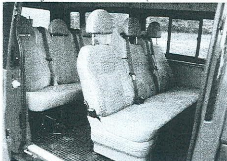
Jedná se o devítimístný vůz

Následně bylo přihlášeno k zařazení do IZS Pardubického kraje v rámci HZS Pardubice a tím bude obec osvobozena od placení zákonného ručení ( výjimka ze zákona ). Závěrem nezbyvá než popřát, aby auto dlouho a dobře sloužilo SDH Břehy a obci. Obec tím získává i důležitý prostředek pro pomoc v obtížných situacích ( povodně, živelné události, doprava osob apod. ). Petr Morávek