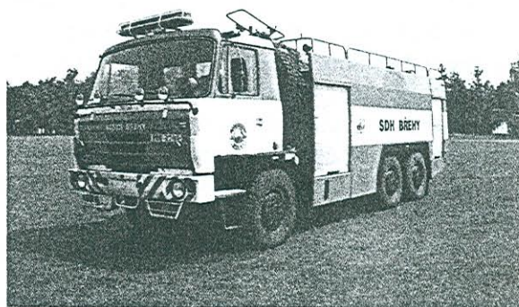
T 815 v majetku obce Břehe