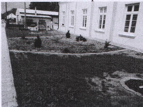
Prostor před bytovým domem si vlastníci bytů upravili svépomocí.

V rámci modernizace přípojek je ukončeno napojení areálu na vodovod, plyn i kanalizaci, takže do budoucna bude možné, podle finančních možností, pokračovat s dalšími stavebními úpravami.